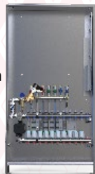
Wohnungsübergabestation außentemperaturgeregelt. Bausatz 1