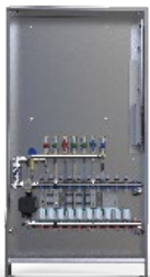
Wohnungsübergabestation Festwertgeregelt. Bausatz 1